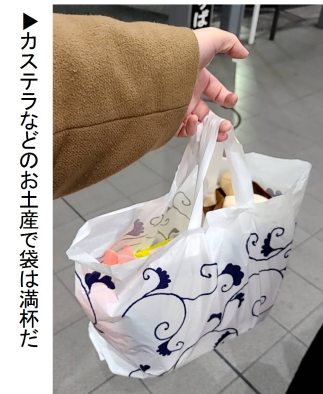
▶カステラなどのお土産で袋は満杯だ

門司港やマリンワールド海の中道での自主研修を終え、新幹線が出発する小倉駅に、体調不良で先に帰った人以外の全員がつくことができた。バスの中では寝ている人が大半だった。時間通り15時58分に新幹線のぞみ178号に乗り、小倉駅を後にした。新幹線のなかでは寝ている人が多かったが、なかにはゲームをする人や勉強する人もいた。また帰り途中には期末テ