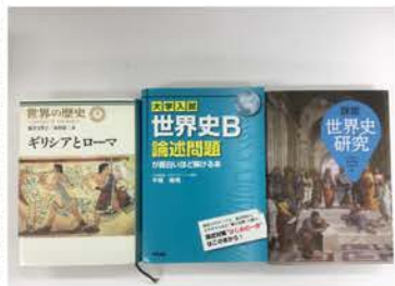
▲先生の読まれた本