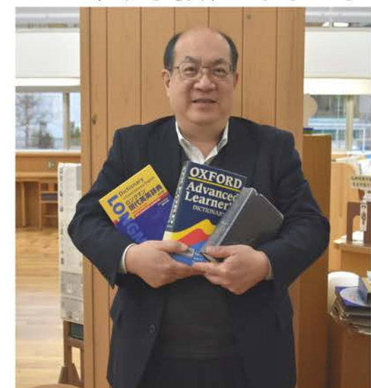
▲辞書の執筆へは他の先生から引き継ぎ、関わるようになった。

この4冊の辞書は、入学直後に学校に指定されたものだ。小椋先生はこの中で一番利用者が多いジーニアス英和辞典について