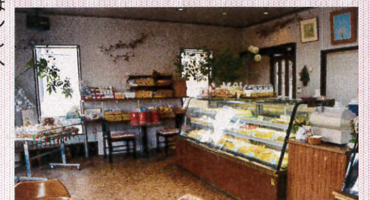
▲店頭にはさまざまな洋菓子が並ぶ。