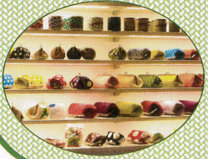
▲畳の縁を素材に使ったたくさんの商品

畳人(たたつと)は、かわいい靴や小物が売られている雑貨屋だ。この店の特徴は、このような雑貨がすべて畳の縁を用いて作られていることだ。昔ながらの落ち着いた柄物の商品や、水玉やチェックなど今どきの可愛い柄物の商品まで、数多くの商品が取り扱われている。ちなみに、『タタット』とは置き畳のことだそうで、この店舗でも販売されている。可愛い小物が欲しい人や部屋の模様替えをしてみたい人は、ぜひ立ち寄ってみてほしい。