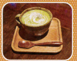
▲取材当日のオススメコーヒー「ケニア レッドマウンテン(左)」と抹茶ラテ