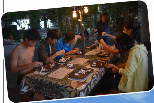
▲珊瑚での風鈴作りを楽しんだ。