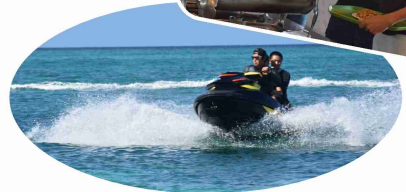
▲マリンアクティビティとビュッフェを楽しむ生徒たち