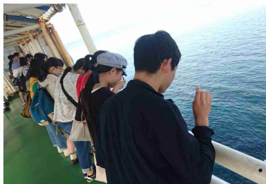
▲クラス別研修でプセナ海中公園を訪れた生徒たちは、渡し橋から魚を観察した。

生徒は2・5・6・8組のあさまりんコースと1・3・4・7組のひるまりんコースに分かれ、マリンアクティビティとクラス別研修を行った。マリンアクティビティは3日目の宿泊地であるホテルムーンビーチで、事前に申し込んだ4つのコースに分かれて、ドラゴンボートやシュノーケルなどのマリンアクティビティ、海ぶどう収穫体験や珊瑚の風鈴作りなどの沖縄ならではの文化体験を楽しんだ。遊泳やビーチバレーを楽しむ生徒もおり、それぞれが