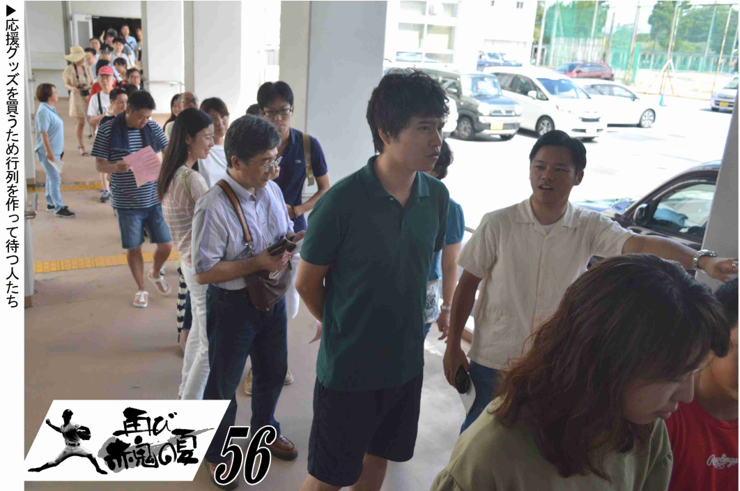
▶応援グッズを買ったため行列を作って待つ人たち