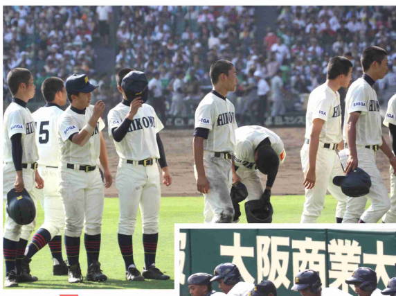
▲2013年8月13日、花巻東高校戦での本校野球部のベンチ入りメンバー