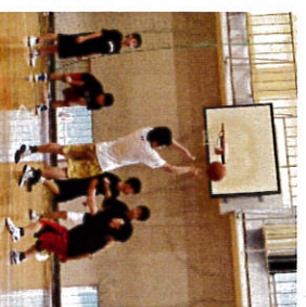
▲練習に励む部員たち

男子バスケットボール部は、現在3年生7人、2年生7人、1年生15人、マネージャー4人の計33人で週6回の練習に励んでいる。