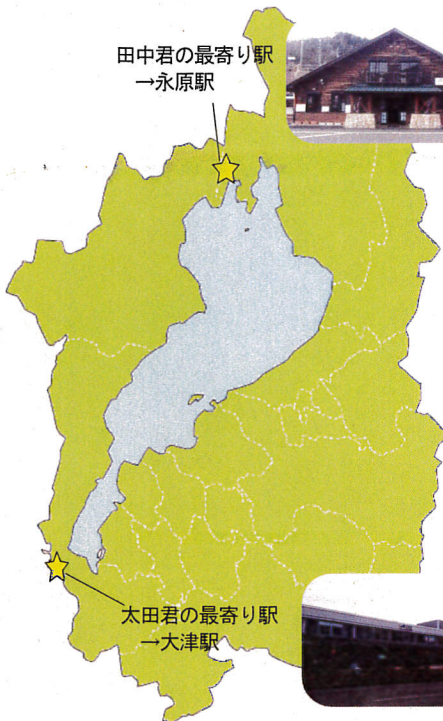
太田君の最寄り駅 →大津駅