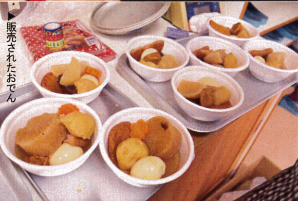
販売されたおでん