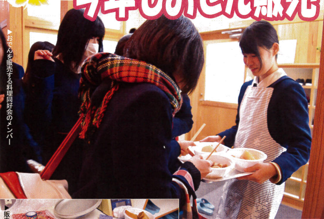
▶おでんを販売する料理同好会のメンバー