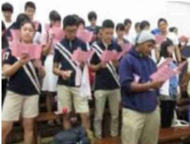
▲「大きな古時計」を日本語で合唱する5組

本校生徒からは「もう少し英語を話せるように勉強しようと思った」「みんなと仲良くなれて良かった」とい