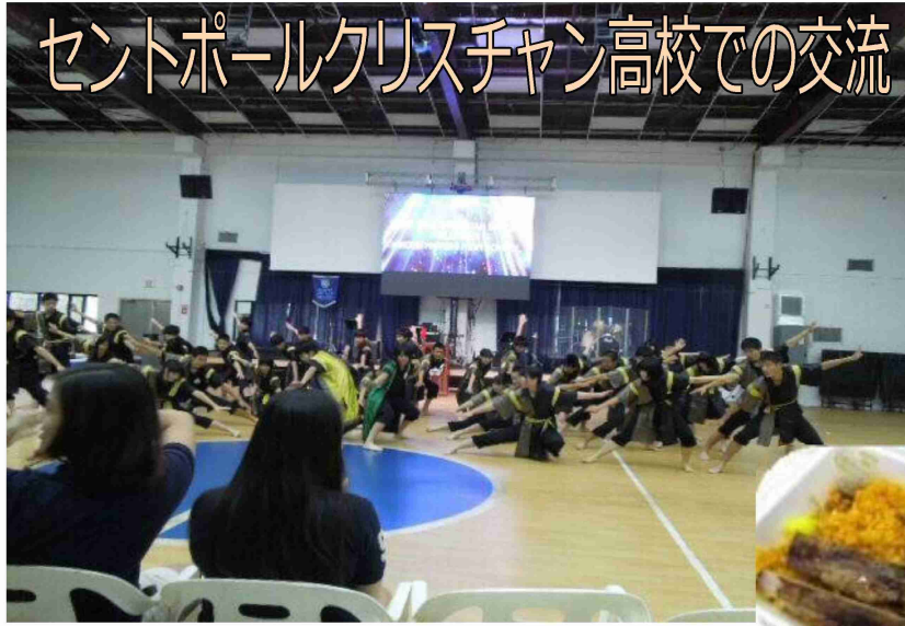
▲ソーラン節を披露する2組

修学旅行2日目、天候は曇り。午前はセントポールクリスチャン高校（以下SPC高校）との交流、午後にはクラス別島内観光が行われた。