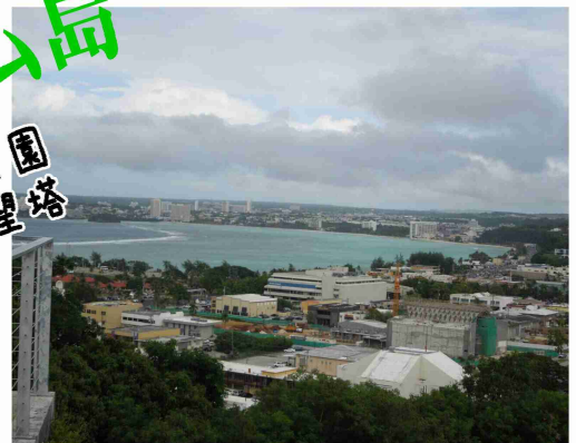
▼アフガン砦からは絶景を望める。