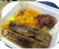
▲SPC高生と食べた昼食

修学旅行2日目、天候は曇り。午前はセントポールクリスチャン高校（以下SPC高校）との交流、午後にはクラス別島内観光が行われた。