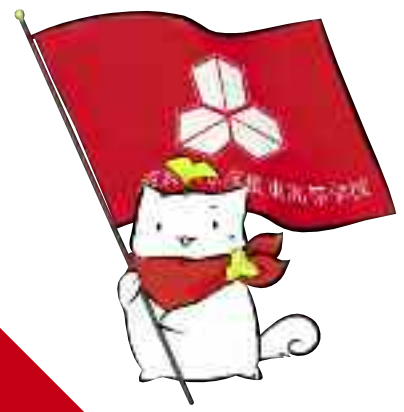
彦根東高校公式キャラクター 「ぎんにゃん」