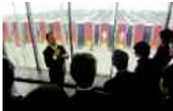
◀理化学研究所研修 (スーパーコンピューター「京」の見学)