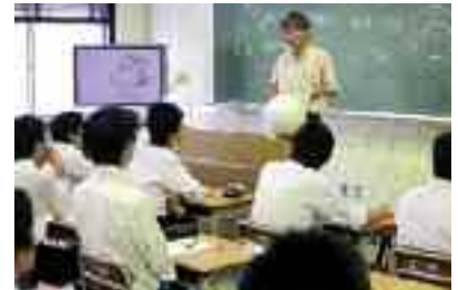
数学基礎講座・数学発展講座