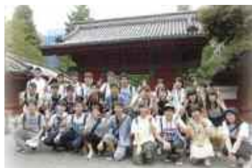
東大オープンキャンパスツアー