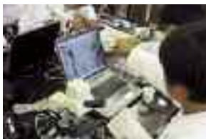
デジタル顕微鏡実習