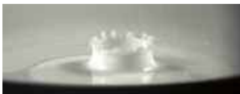
高速度ビデオカメラを使ったミルククラウンの映像

本校には、SSHで整備された各種実験装置、観測機器やプロジェクター、資料提示装置等の機材がたくさんあり、理科・数学の授業や課題研究、SS部（科学部）の実験等に利用されています。