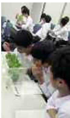
▲京都大学 生態学研究センター