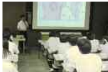
▲滋賀医科大学研修 (滋賀医科大学で講義と見学)