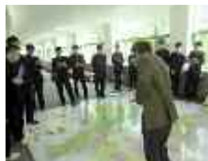
産業技術総合研究所研修