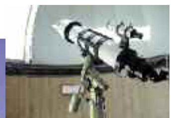
15cm屈折望遠鏡 （香川県の天体望遠鏡博物館より寄贈）