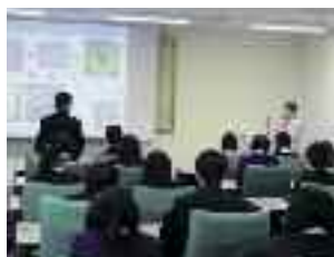
理化学研究所（神戸研究所）

大阪・神戸の研究機関や施設を訪問し、先端科学・科学技術に関する知識と理解を深めます。