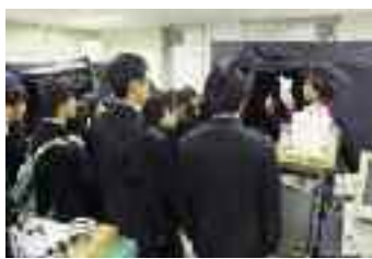
◀名古屋大学農学部