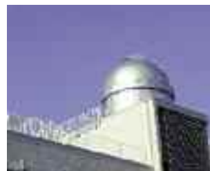
天体ドーム（第二本館）

2015年3月、耐震改修工事の完了にともない、天体ドームに15cm屈折望遠鏡が搬入されました（香川県の天体望遠鏡博物館より寄贈）。天体ドームと望遠鏡の稼働は県内高校でも少なく、貴重な存在です。