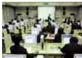
パソコンソフトを用いた数学実習