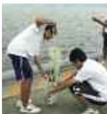
琵琶湖博物館実習

全国のSSH指定校の代表生徒が集まる研究発表大会。もちろん、本校の生徒も発表します。