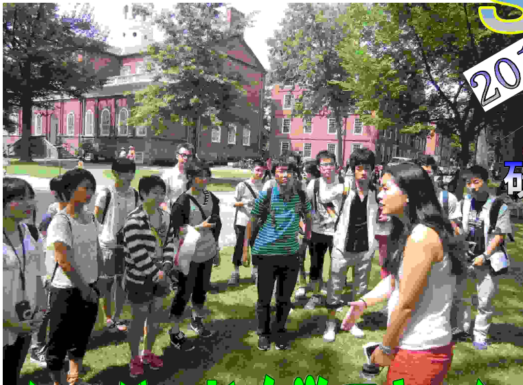
▼ハーバード大学の中を案内してもらう生徒たち