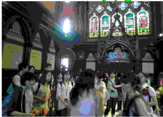
▲ステンドグラスが美しい

パスツアーで大学内の有名なスポットを見て回った。中でも1年生用の食堂は「ハリポッターに出てくる場所のようで、とても大きかった」と驚きの声があがっていた。 この日の昼食はハーバード大学内でとった。いろいろな野菜が包まれたタコスが、とてもおいしかったそうだ。