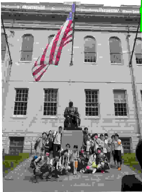
▲3つの嘘が隠されているジョンハーバードの像の前で

ハーバード大の後はワシントンへ。航空宇宙博物館を見学した(=写真右)。館内は多くの飛行機でいっぱい、生徒の一人は「飛行機の進化の様子がよくわかり、発明した人はすごいなと思っ