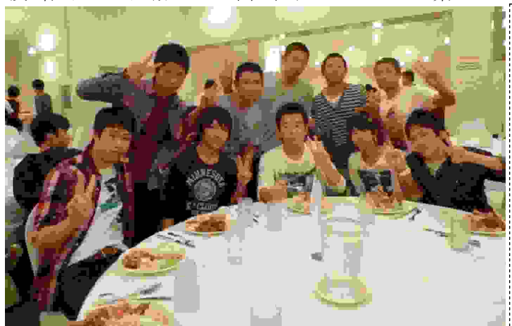
▶ピュッツフェを楽しみ、生徒たち

修学旅行1日目のグアムの天候は晴れで、少し動くだけで汗が出てくるほどの気温だった。今日の移動では大きなトラブルもなく、ほぼ予定通りの時刻にホテルに到着した。また長時間に及んだ移動の疲れを癒すため、今日は大きな行事は何もなく、生徒はホテル内でそれぞれゆっくりとした時間を過ごした。