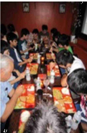
日本料理店での夕食の様子

ITでの学生(研究)生活について話を聞き、その後、広々としたMIT構内を説明を受けた。昼食はMITの大学院生4名とともに交流をもつ機会ができた。午後は、MIT核研究所での核分裂についての講義と施設の見学研修をし、実験設備の構造と核反応について理解を深めた。