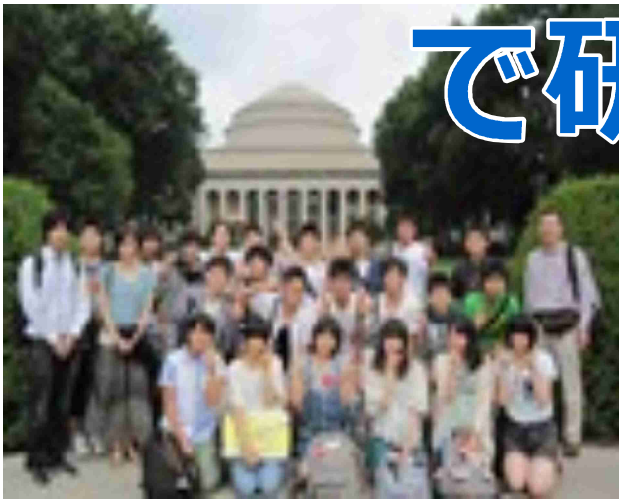
有名なドーム前で記念撮影

7月23日、日本を出る航空機が、1時間20分遅れで出発した関係もあり、デトロイトの乗り換えが慌ただしくなったが、無事、ボストンのホテルに到着した。