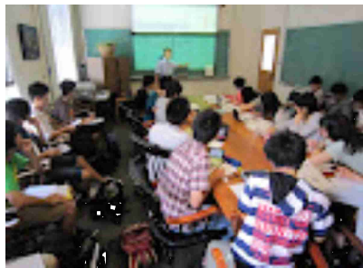
MIT核研究所での講義