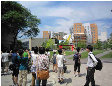
広大なキャンパスの中を歩く

った。少し強い雨だったが、室内の研修中で特に影響はなく、午前は、MIT(マサチューセッツ工科大学)の日本人大学院生による講演があり、M