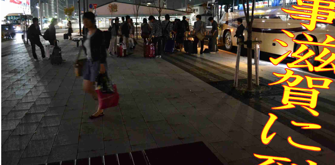
▲彦根駅の前で荷物を受け取り解散する生徒達