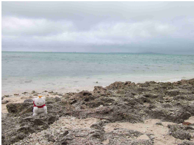
▲雨が上がった空と海岸に座るぎんにゃん 海の水は透き通ってきれいだった