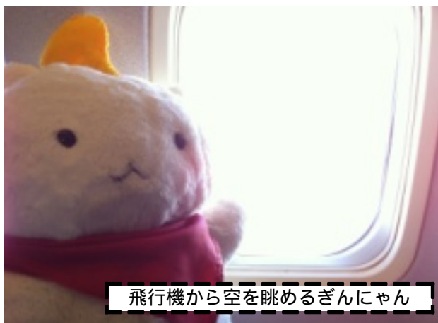
飛行機から空を眺めるぎんにゃん