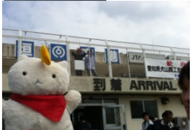
ぎんにゃんも石垣空港に到着!