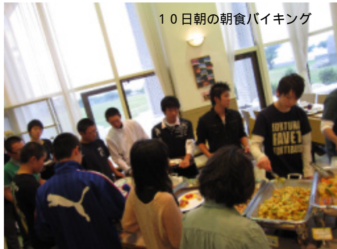
10日朝の朝食バイキング