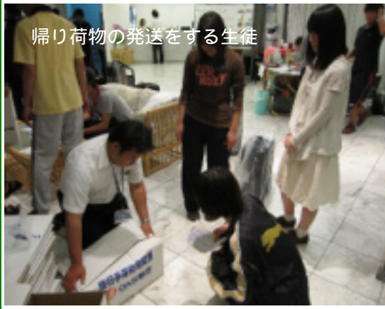
帰り荷物の発送をする生徒