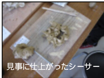
見事に仕上がったシーサー

竹富島に到着し、クラスの記念撮影をした後、生徒の多くは約2時間レンタサイクルで島内を見て回った。島の南西に位置するコンドイビーチが人気で、海パン姿で海に入り水遊びをしてはしゃいだり、浜辺でビーチバレーをして楽しむ生徒たちが見られた。ビーチ周辺には多くの野良猫がいた。竹富島中心部にある登録有形文化財のなごみの塔からは竹富島の町並みが美しく見えた。竹富島には牛がたくさんいて、牛たちは牛車で観光案内をしたり、牧場で飼育されていたりした。竹富島でのサイクリングを終えた2年7組男子生徒は「建物が少なく、地元の人にあまり会わなかった。人よりも牛の方が多い気がした」と感想を話してくれた。一行は竹富島を出発した後、石垣島離島ターミナルに着き、ホテルに向かった。かくしてクラス別研修は終了した。(鱒)