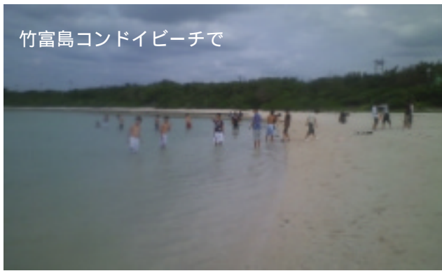
竹富島コンドイビーチで