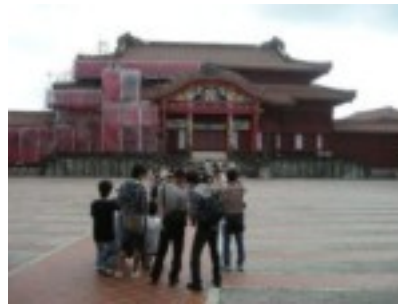
首里城の前でみんなで楽しく記念撮影

9組はむら咲むらで研修を行った。首里城では1組が到着した時には他の修学旅行にきた学生でいっぱいになっていた。首里城正殿までの石段は数えてみると43段。残念ながら首里城正殿は一部修繕中だった。その後、1組は魔文仁の丘へ向かった。慰霊碑には沖縄の戦死者の名前が刻まれている。また、太平洋側には平和を願ったモニュメントがあり、そこから海を眺めると、東尋坊のような崖