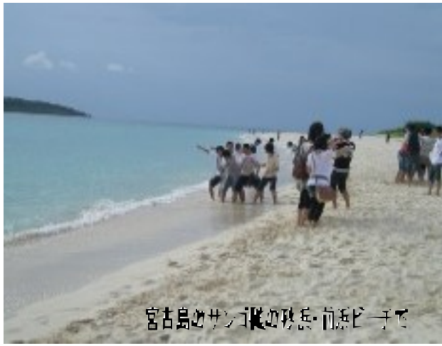
宮古島のサンゴ礁の残存・前浜ビーチで