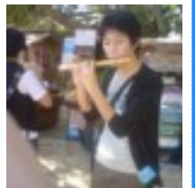
横笛・三線に挑戦

また、宮古島では島内観光も終わりに近づいたころ、あるバスガイドさんによる三線の演奏が始まった。そこで、2人の生徒が三線に挑戦。ギター経験のある2人は、出発時間までの10分ほどで、曲を引くまでに至った。その後、バスの中でバスガイドさんが歌と三線を披露してくださった。沖縄の楽器にふれたひとコマであった。(A団・驢)