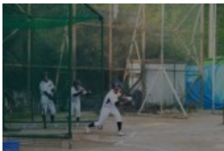
放課後、練習をしている野球部

『輝け青春』シリーズ、運動部の最後は野球部である。雨の日も風の日も練習に励む野球部は今、7月11日から26日まで行われる第91回全国高等学校野球選手権滋賀大会に向けて、調整の時期に入った。第一試合は11日の午後2時から、皇子山球場で行われる。対戦相手は膳所高校である。