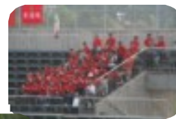
保護者の方々と部員たちの応援の様子