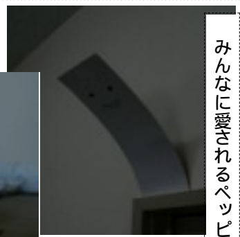
文芸部員を棚の上から見守っている大仏