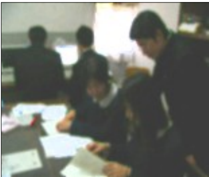
熱心に活動する文芸部