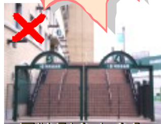
1塁特別自由席入口