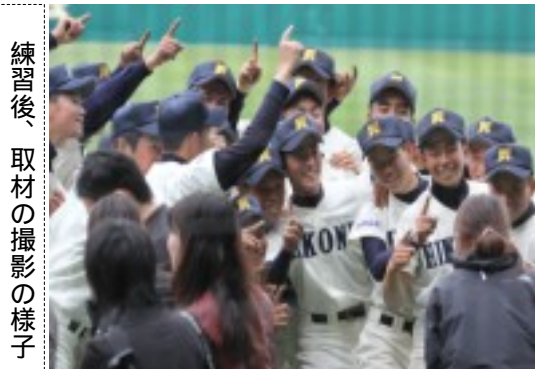
練習後、取材の撮影の様子