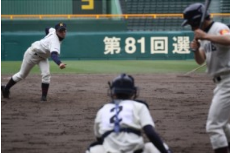
甲子園球場での練習風景