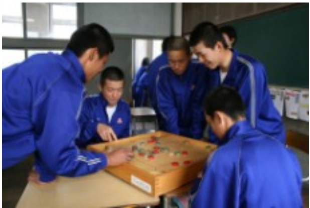
空き時間の「練習試合」の様子

16日に行われた球技大会の男女混合カロムの部には多くの野球部員たちが参加した。チームワークを生かした作戦や、他の仲間からの応援など、土俵は違えども、彼ららしさを十分に感じるこのできる競技だった。