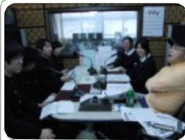
スタジオでの収録の様子

は俺が入れるから、お前はこっちの玉を頼む」といった声が飛び交っていた。 1年生の部員の中にはカロムを初めてやる部員も何人かいたが、試合の回数を重ねるごとにコツをつかんでいたようだ。