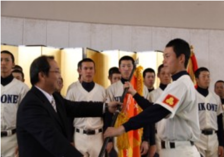
校長先生から選抜旗を手渡される新谷主将。