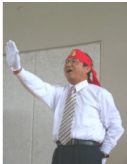
赤いハチマキで野球部にエールを送って下さる校長先生。