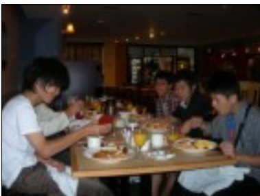
ホテルでの朝食。朝から高カロリーです。